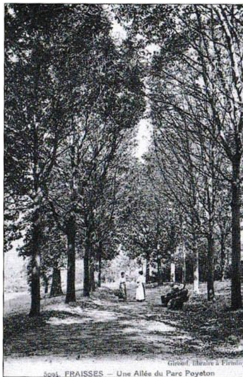
Allée du parc. Carte postale ancienne