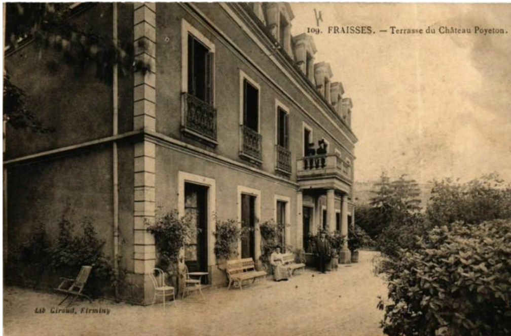
Terrasse du château. Carte postale ancienne

façade plane, la simplicité de son architecture contrastait avec celles beaucoup plus monumentales de ses illustres voisins, les châteaux Holtzer et Dorian.