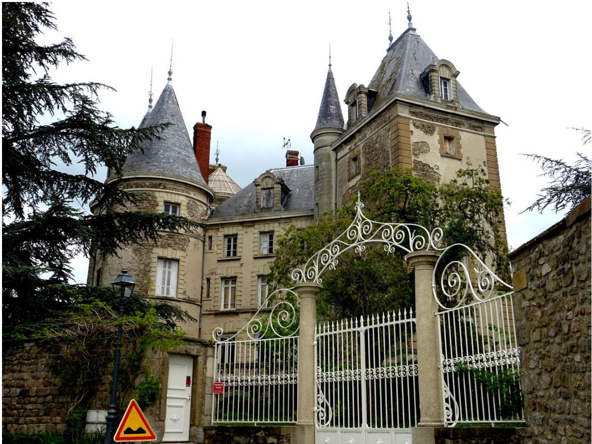
Façade de l'entrée