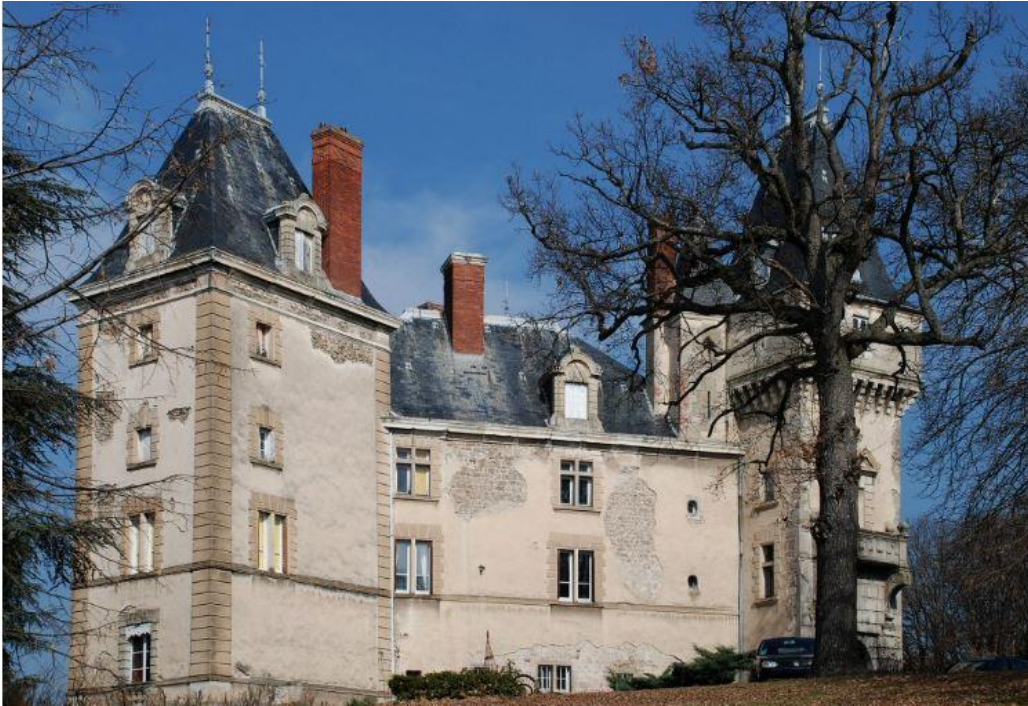
Façade arrière donnant sur le parc