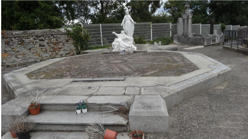
Ce qui reste de la chapelle: le socle