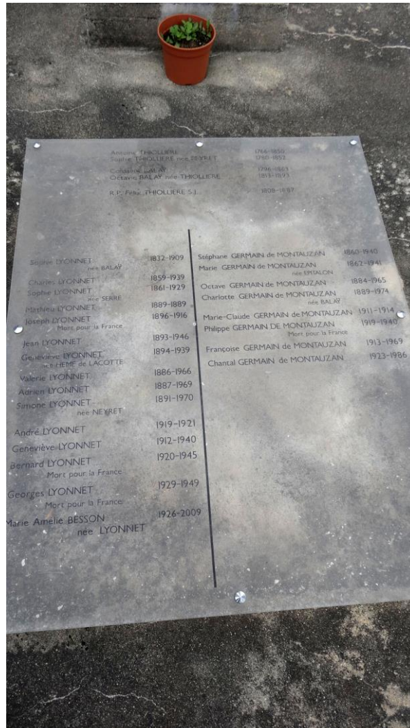
Les familles Balay - Thiollière - Epitalon- Serre - Lyonnet - Germain de Montauzan ici rassemblées : Le gotha de la bourgeoisie du textile stéphanois