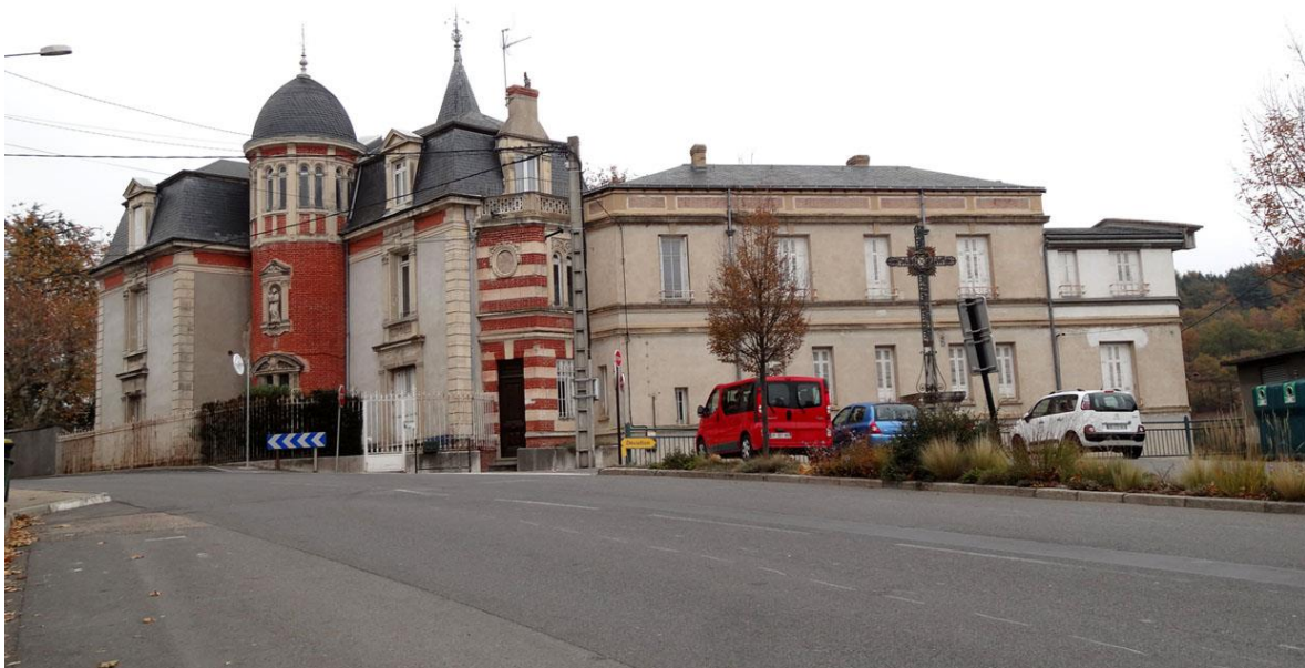
Vue d'ensemble : bâtiments anciens et aile plus récente

La tour centrale offre une composition décalée par sa forme et par sa décoration. A l'étage, le dôme est soutenu par une sorte de lanterne à arcades géminées qui évoque une architecture d'église. Cet étage constituait en fait l'arrière de la chapelle logée à ce niveau. Une niche surmontée d'un fronton triangulaire et encadrée de pilastres abrite une vierge. La porte d'entrée au pied de la tour est surmontée par une lucarne à deux fenêtres, encadrées par des pilastres richement décorés. Ils supportent un fronton en demi-cercle brisé, orné d'armoiries et de motifs en feuillages.