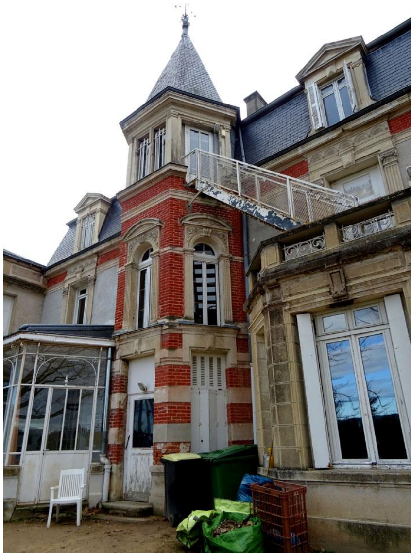
Vue de la façade sud. Belle tour à toit clocher Diversité et richesse des encadrements.