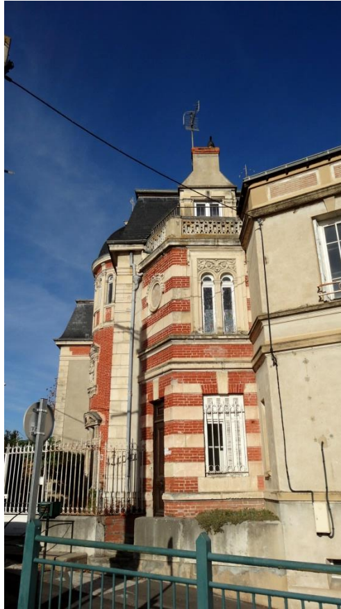
Façade sur la place