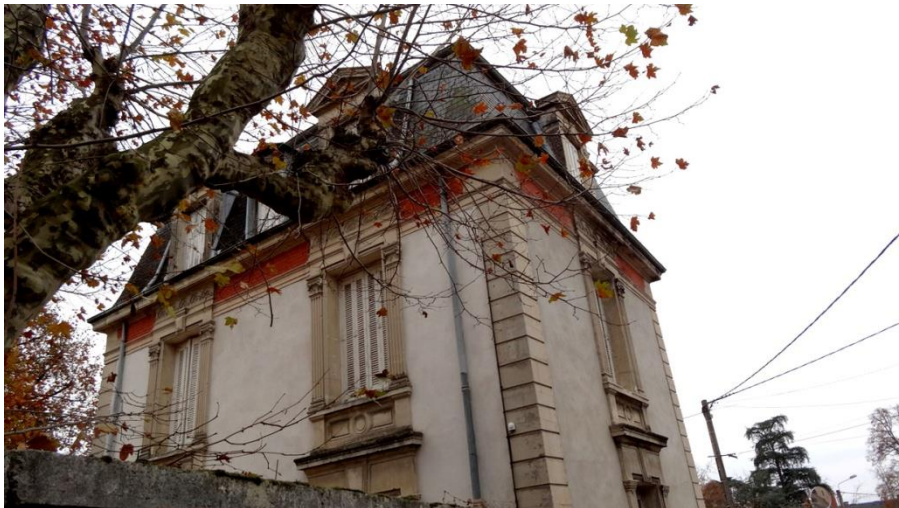
Éléments de façade arrière