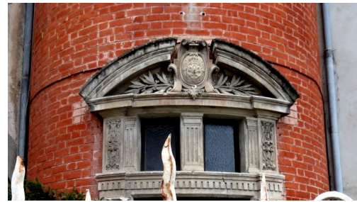
Fronton circulaire brisé

Tour d'angle, avec décorations et son étage de la chapelle