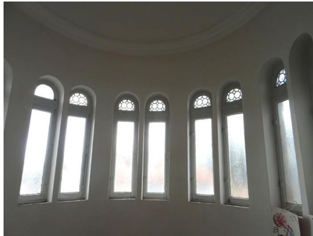
Intérieur de la chapelle

Tour d'angle, avec décorations et son étage de la chapelle