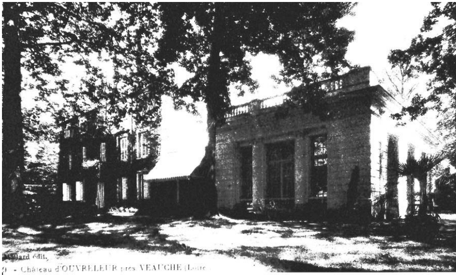
Jard d'ait, Château d'OUVRELEUR près VEAUCHE (Loire)