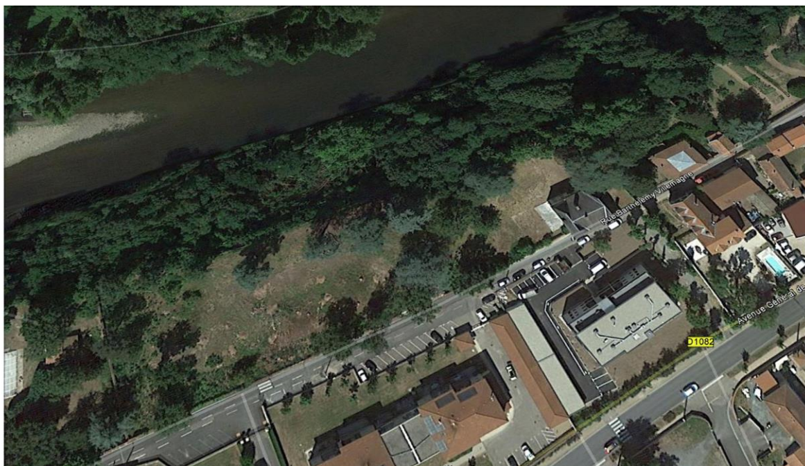
Le parc et le bâtiment sont situés entre la Loire la rue Barthélémy Villemagne

La maison est située au n°28 de la rue Barthélémy Villemagne dans un vaste parc surplombant la balme de la Loire. Elle présente les caractères d'une maison de plaisance réalisée avec des attributs d'un petit château.