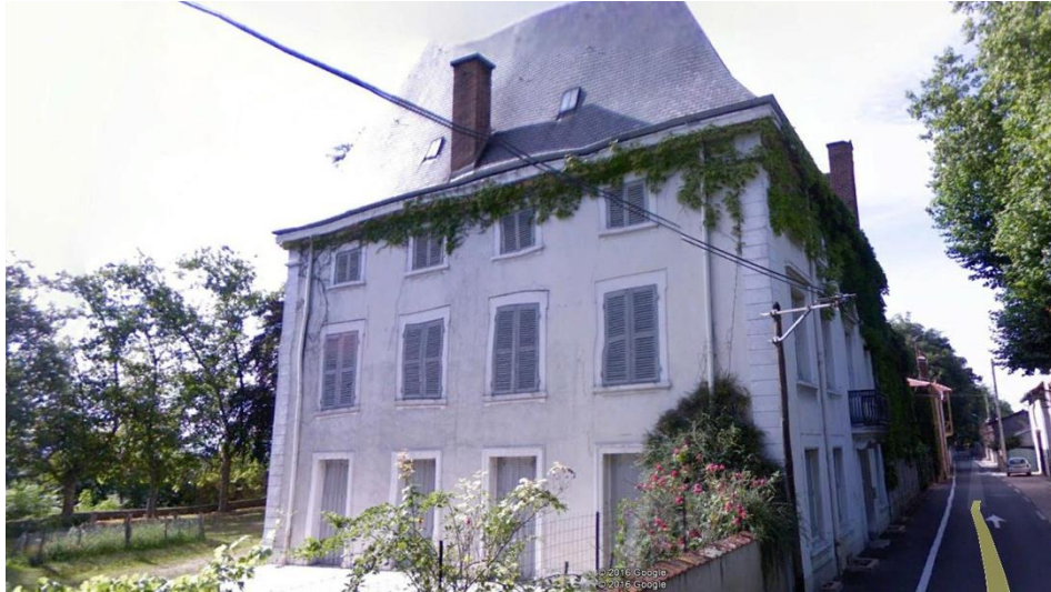
La façade sud après démolition du pavillon