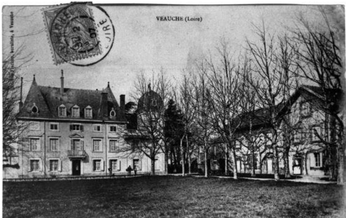
Le bâtiment vers 1900.

Une carte postale antérieure montre que le bâtiment a subi d'importantes transformations. Vers 1900, les deux ailes qui avaient été ajoutées par Léon Douvreur ont disparu : celle de gauche d'un niveau était pourvue d'arcades ; celle de droite comportait une tour surmontée d'un dôme. La toiture était à deux versants, avec des jacobines qui ont été supprimées.