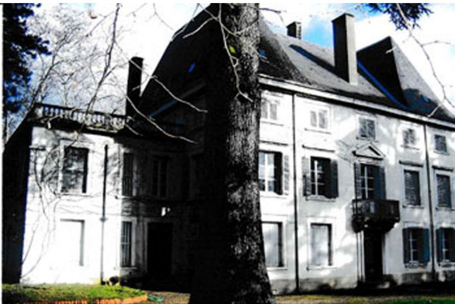
Façade sur la rue avec le pavillon à gauche