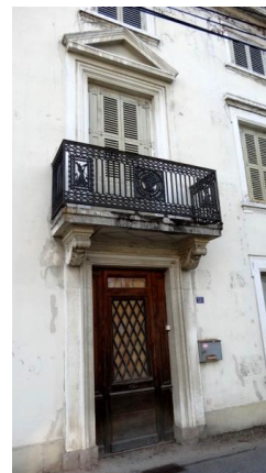
porte d'entrée et balcon