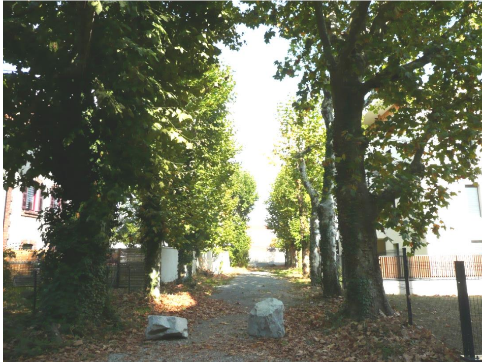
Allée de platane interrompue