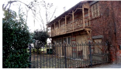
Maison de jardinier

La maison du jardinier avec sa loggia et sa décoration en brique est de très belle facture. On peut également voir un reste du réservoir d'eau.