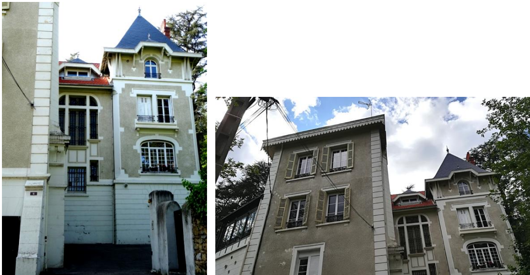
Façade de style Art Nouveau

On trouve aussi une échauguette à toit pointu, référence néo-médiévale assez incongrue, plaquée sur la façade arrière, qui souligne l'éclectisme de l'architecture.