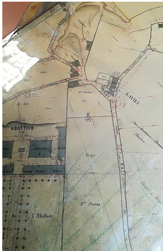
Plan de 1880 montrant les propriétés Prodon (Archives municipales de Saint-Chamond)

Un plan cadastral datant de 1880 montre que la famille Prodon possédait une vaste propriété au dessus de Lavieu. Elle comprenait un large espace de vignes et de vergers entre l'actuelle rue Voltaire (et jusqu'à l'actuelle rue Waldeck Rousseau) et les abattoirs. Une autre grande parcelle située au nord de la maison et en bordure d'une ancienne carrière était planté en vignes.