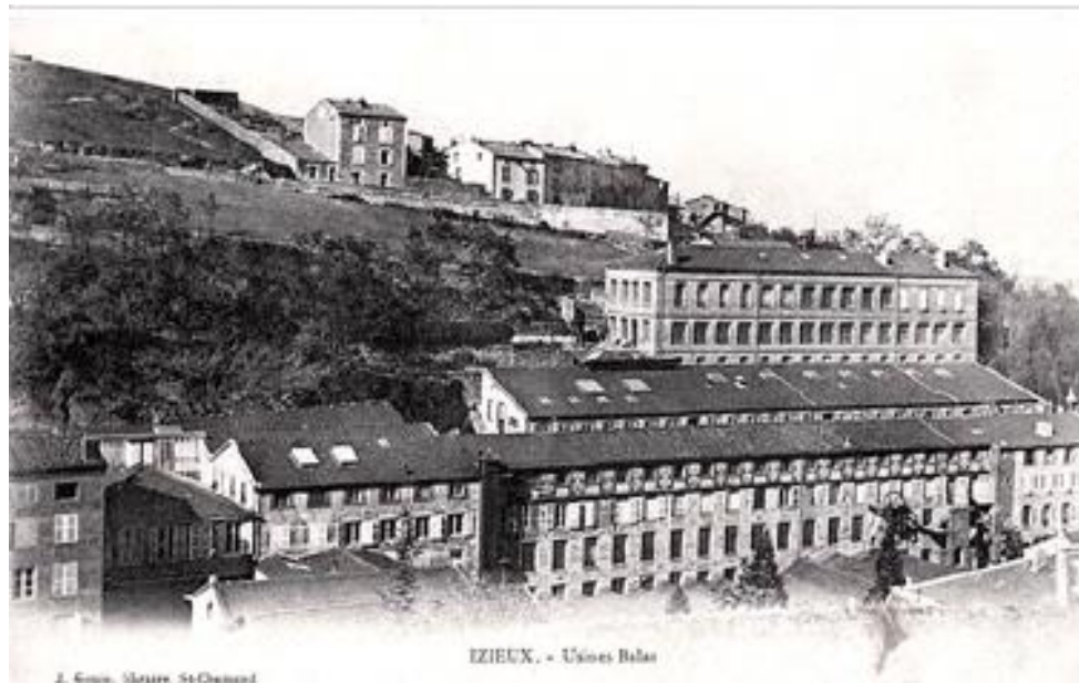
Les usines Balas à Izieux