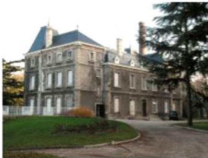
Le château de la Bruyère, Balas-Prodon à Izieux