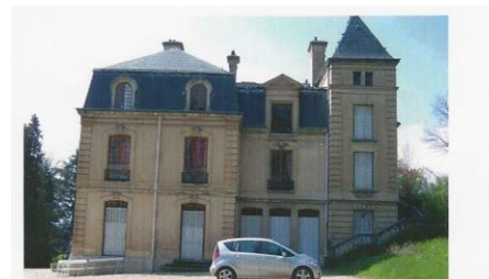
Façade Ouest et Est

La façade nord est composée d'un corps principal entouré par deux pavillons. Au sous-bassement, il y a un escalier à deux volées convergentes qui dessert la chapelle. On y trouve