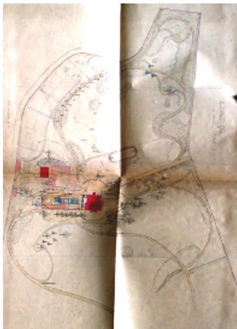
Projet d'aménagement paysager de Luizet Barret (vers 1910)