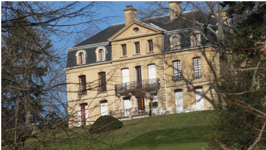
La façade sud

La façade sud est la plus travaillée. Elle comporte 7 travées.