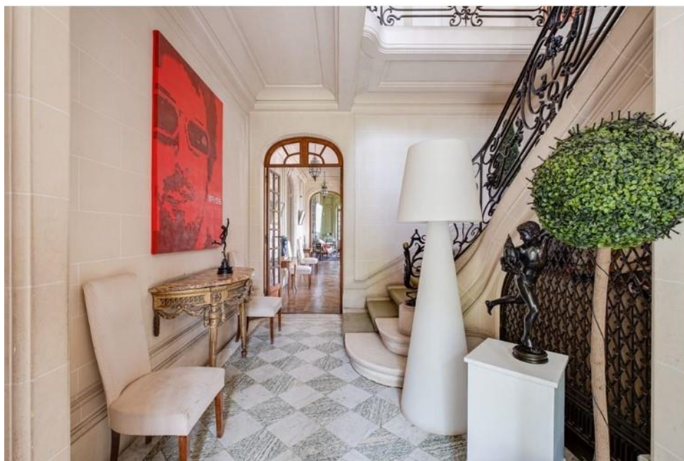
Vestibule et enfilade