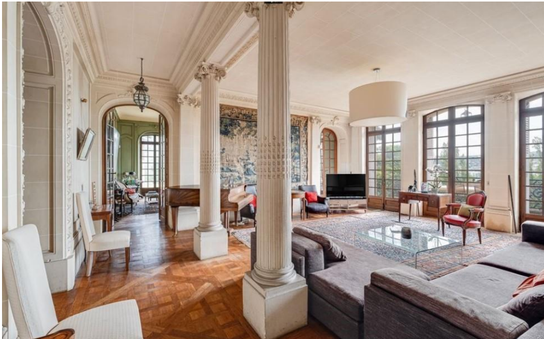
Pièce de réception

La demeure offre une très importante surface habitable de 770 m 2 pour 18 pièces et une chapelle. La pièce de réception a de très larges proportions et un aménagement somptueux.