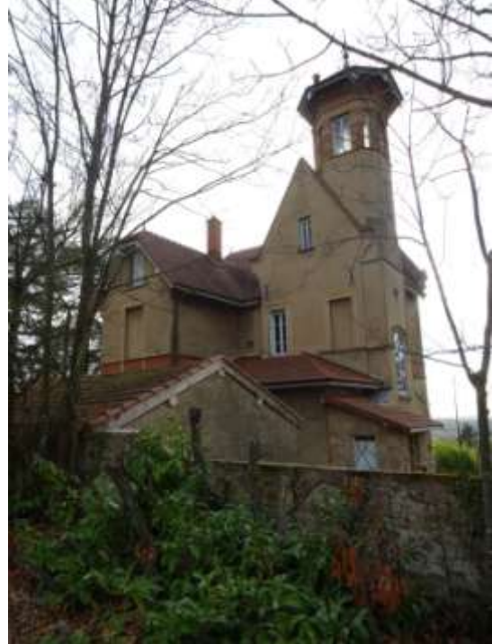
Façades est et nord.

Les façades nord illustrent le jeu complexe des décrochements des volumes et des toitures