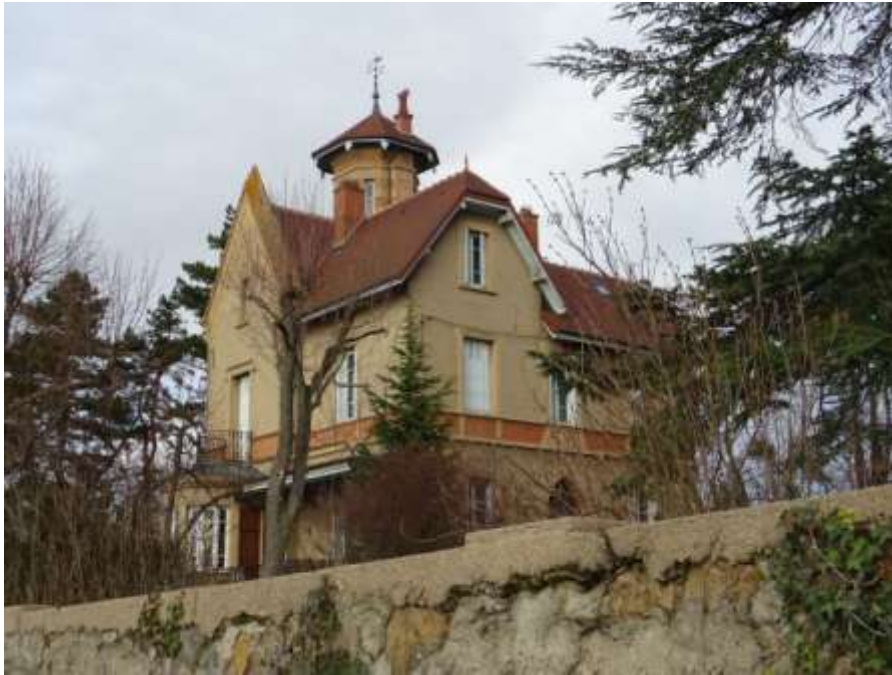
Façades ouest et sud montrant le jeu complexe des décrochements des volumes et des toitures

La tour de section octogonale est bâtie en brique et a des allures de pigeonnier qu'elle n'était pas.