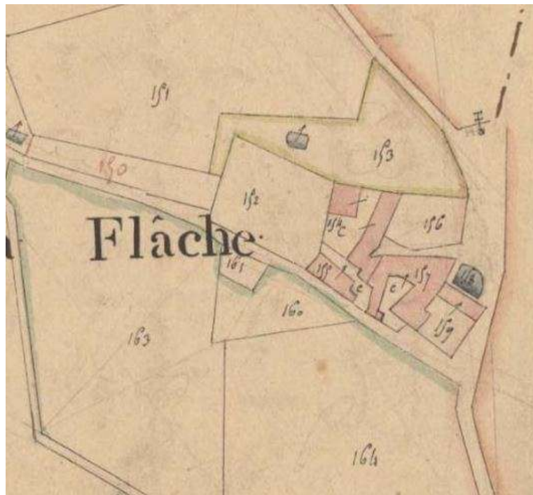
Parcelles C157 et 159