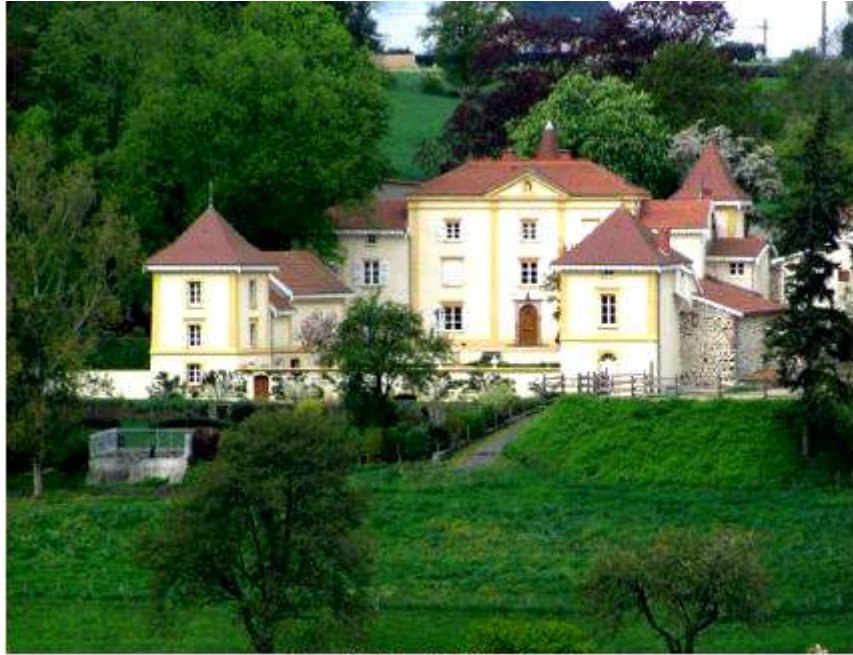
(2 mai 2010, cliché J. Baron)