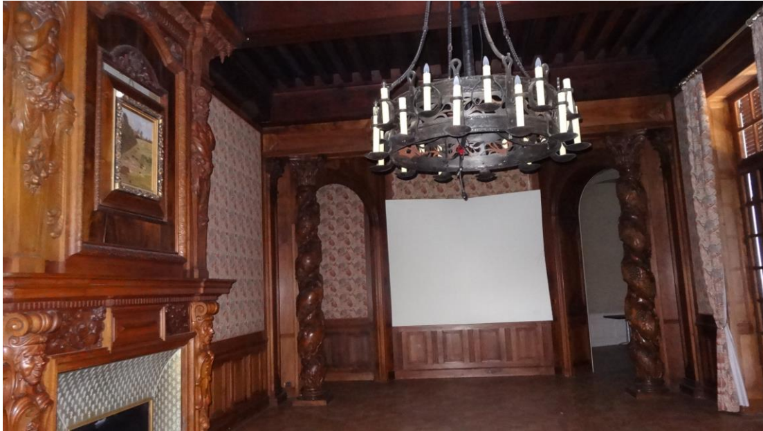
La riche décoration d'une pièce de salon