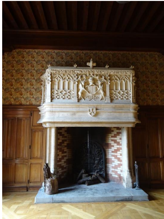
cheminée richement ornée de cariatides et cheminée à manteau en pierre sculptée