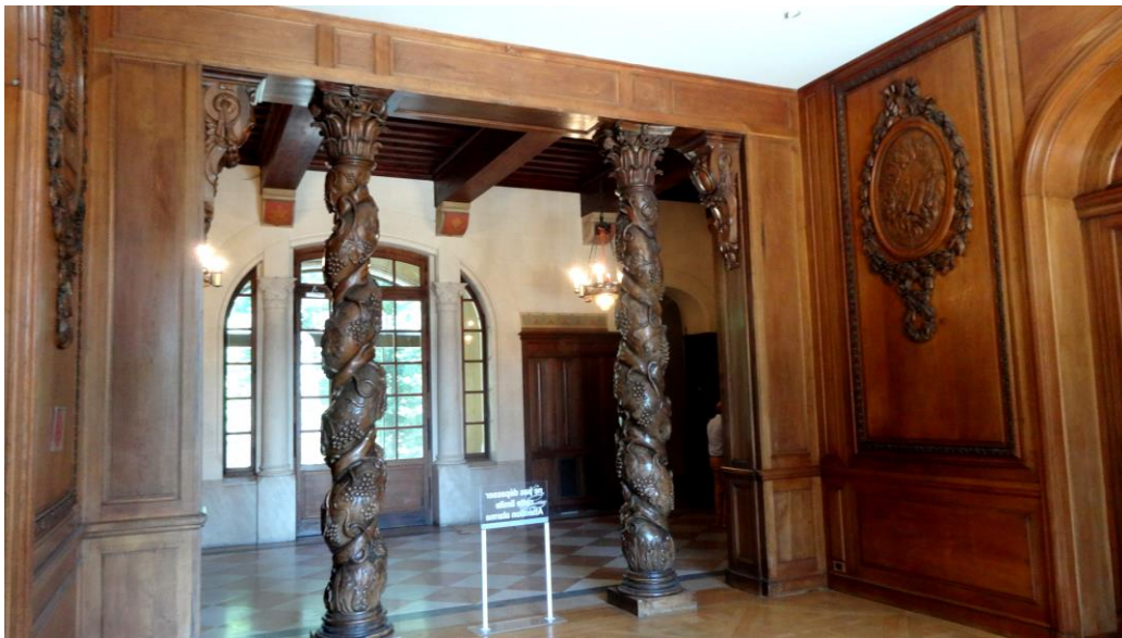
Le hall d'entrée avec ses colonnes torsadées et richement sculptées

Il est à la hauteur de celui de l'extérieur et en a repris les mêmes intentions : une ambiance très solennelle et sombre donnée par les décors de boiserie omniprésents et de grande qualité.