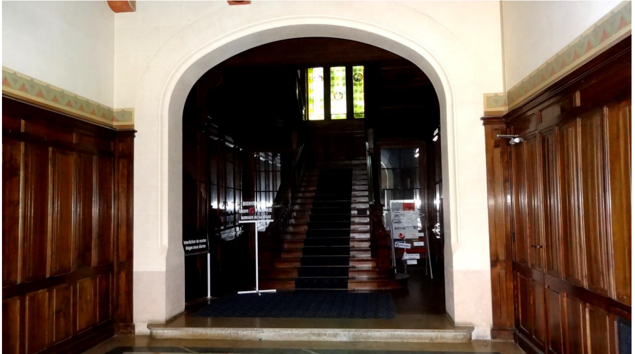
Escalier d'accès au premier étage confectionné en noyer