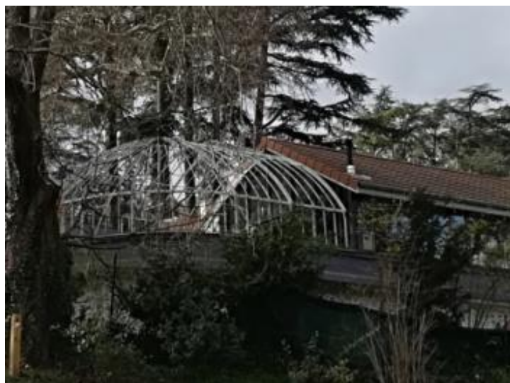
Bâtiment du personnel une belle architecture de serre restauré en logement