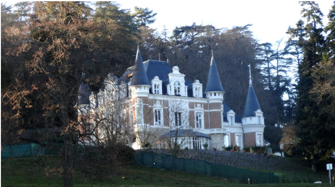
Façade sur parc avec serre ronde

Tout cela lui confère une réelle élégance dans un parc agrémenté de très beaux arbres.