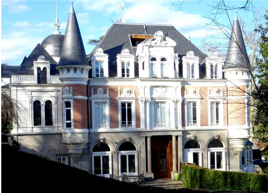
Façade ouest. Belle mise en scène entre deux tours en échauguette, fenêtres en mansardes encadrant une grande lucarne à fronton brisé. Ornements prolifiques et jeux de couleurs avec la brique. Le velux percé dans la toiture détonne un peu dans ce décor.