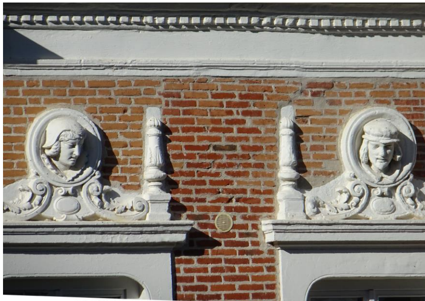
Décor de têtes qui fait penser à la maison des têtes (place J. Jaurès) où étaient installés les bureaux de la société Fraisse