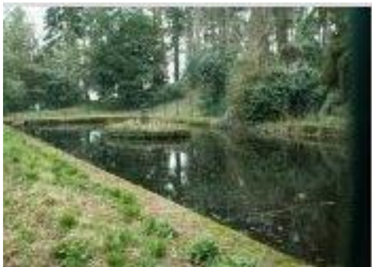
Le grand bassin

De belles allées plantées de platanes ont été conservées comme sentiers de promenade. Au dessus du château, on peut encore voir le grand bassin qui avaient été aménagé pour recueillir les eaux de ruissellement et desservir le château, ainsi que les grottes en rocaille situées sur ses rives, et un peu en contrebas la cressonnière.