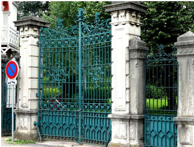
Portail de la propriété avec les monogrammes Fraise-Merley et Fraise

Le style de type florentin, de part la forme de la tour carrée et de sa toiture, est assez courant dans les villas édifiées entre 1870 et 1914 (cf l propriété Milliarède à La Talaudière). Cela laisse penser que sa construction est moins ancienne que le château.