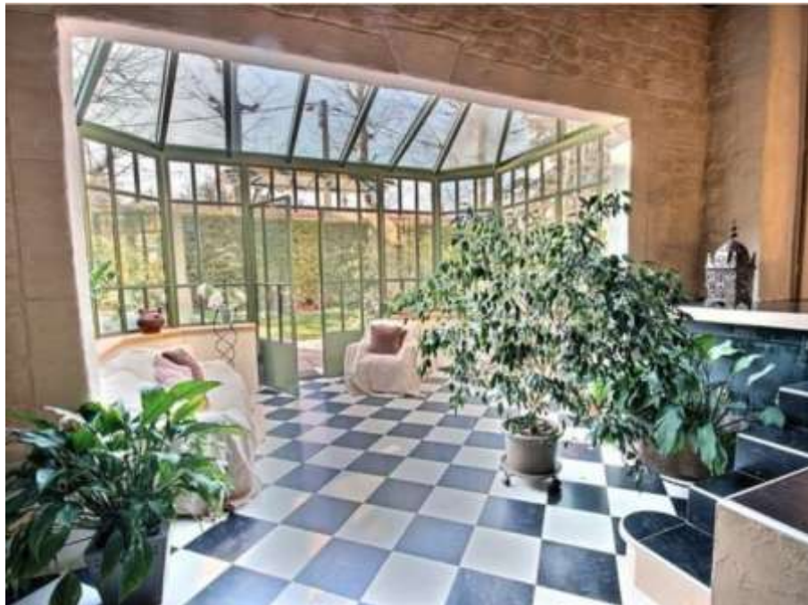
Espace de détente avec spa et véranda

chambres, un bureau, une salle à manger, une cuisine équipée et deux salles de bains. Elle comprend également un espace détente avec SPA donnant sur une véranda.