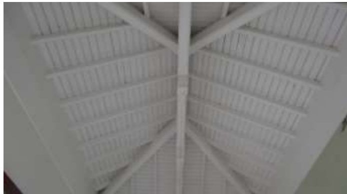
Détail du plafond du sommet de la tour

La tour est couronnée par une toiture presque plate. On, remarque l'ornement par la frise en céramique associant le bleu et le marron, qui est caractéristique de l'époque.