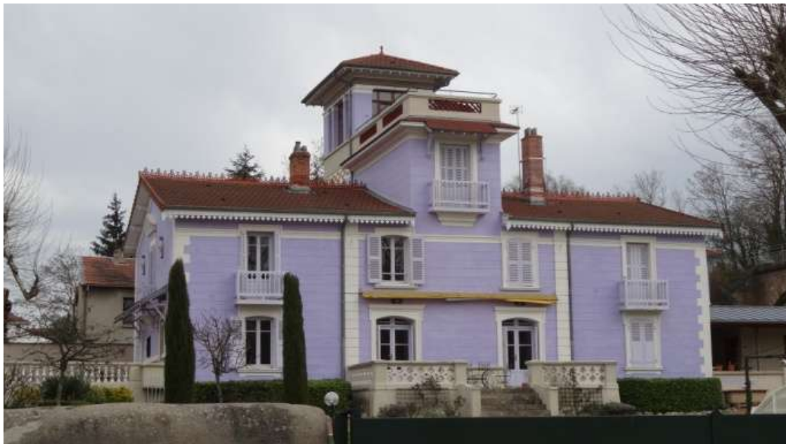
Fa ade principale ouvrant sur le jardin

La couleur mauve de la fa ade, qui la fait ais ment remarquer, est la couleur adopt e d s 1906 et qui a toujours  t  conserv e.