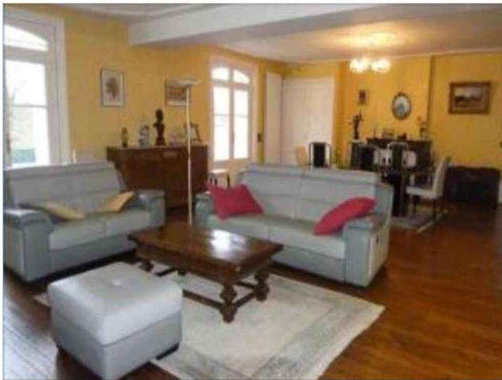
Salle de séjour résultant de la réunion de deux pièces initiales