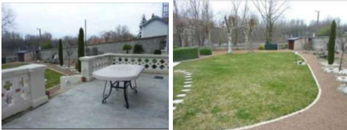
La terrasse, avec le jardin et la Loire

Une grande terrasse d'origine ouvre sur un grand jardin qui descend jusqu'à la Loire et situé en zone inondable.