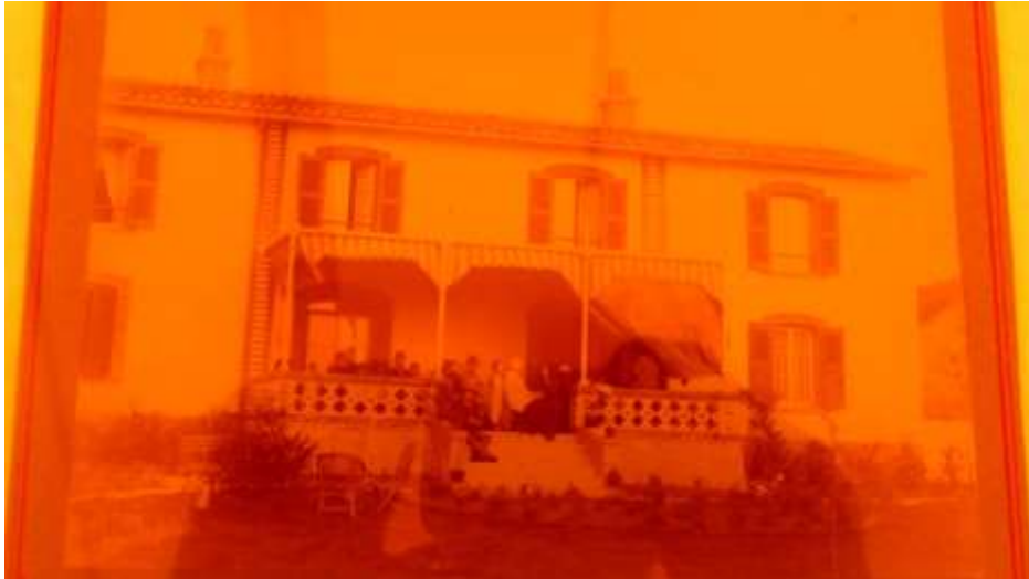
La maison en 1900