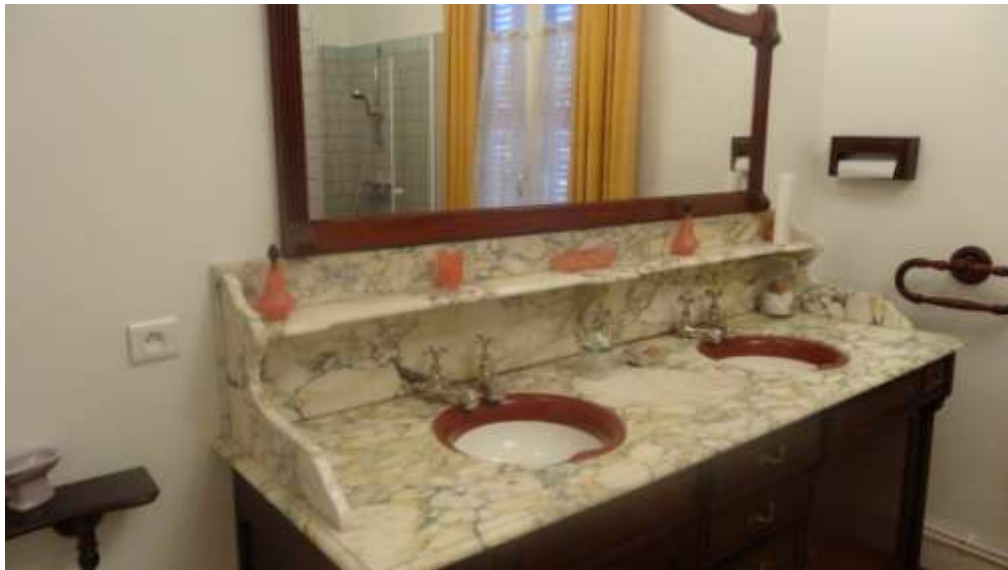
Belle salle de bain des années 1960 au rez de chaussée