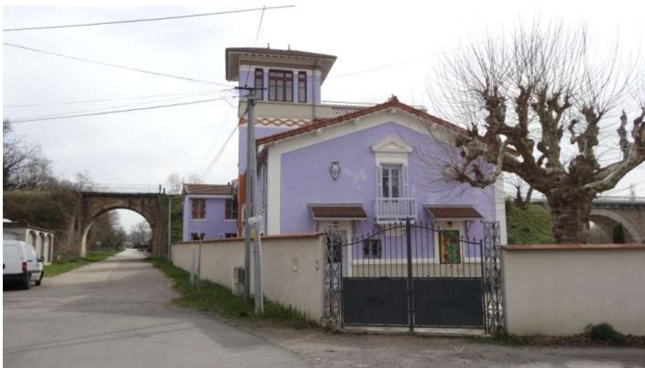
Façade ouest recomposée. Décorations avec fronton au dessus de la fenêtre centrale. Sur la gauche, un dauphin en faïence