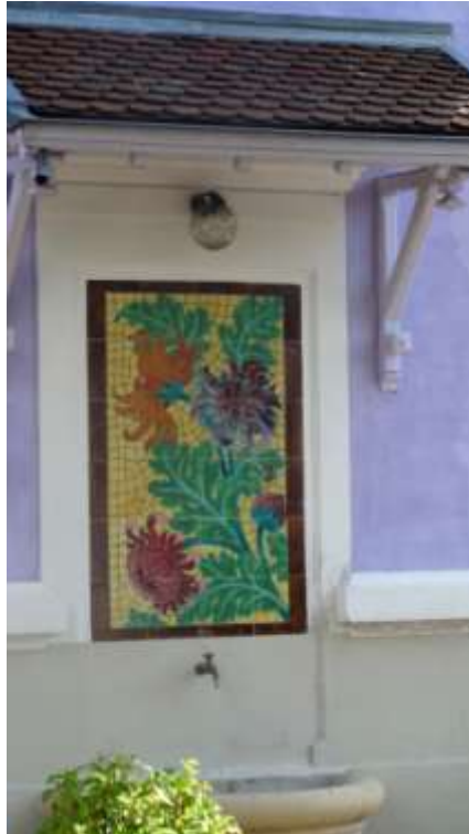
Fontaine et fresque en faïence sous avant toit