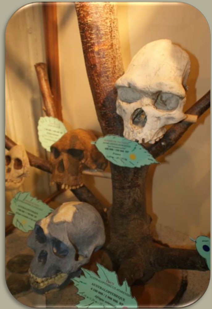
L'Évolution de l'Homme Le plus vieil européen