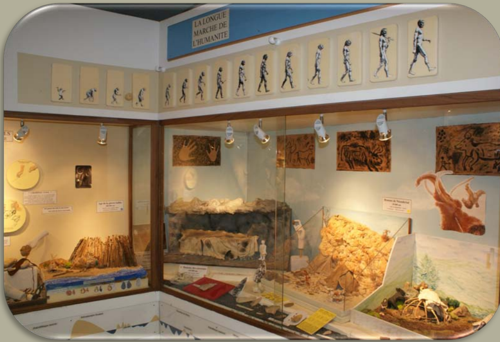
Salle de la préhistoire