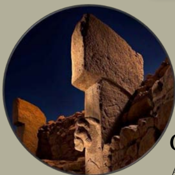
Göbekli Tepe Agriculture ?