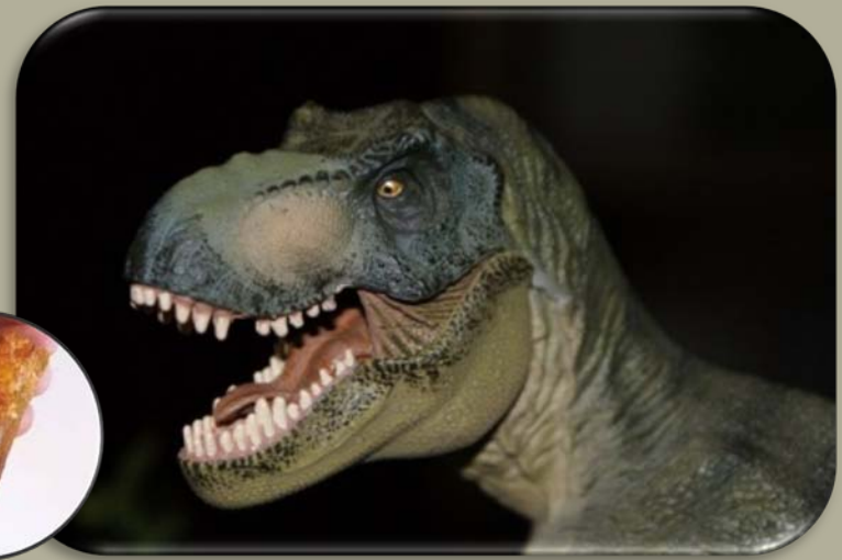
Une dent de dinosaure

Saint-Étienne a donné son nom à un étage géologique : le Stéphanien