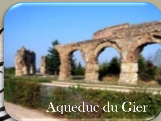
Aqueduc du Gier