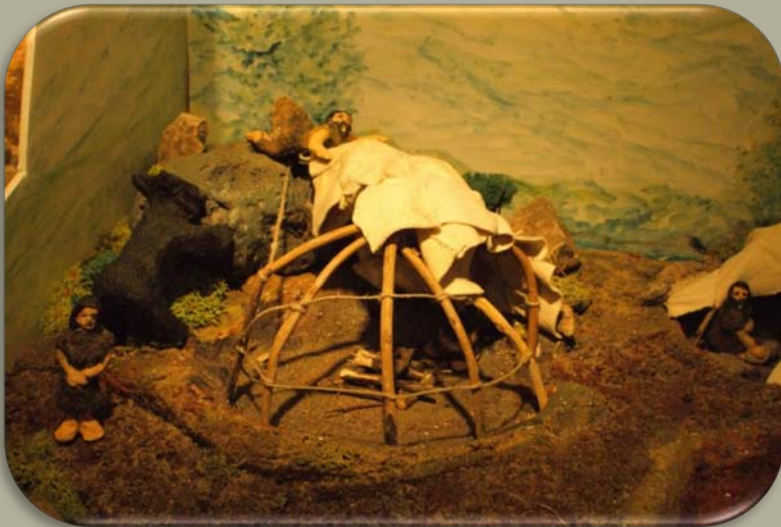
Cabane de Villerest (Loire)